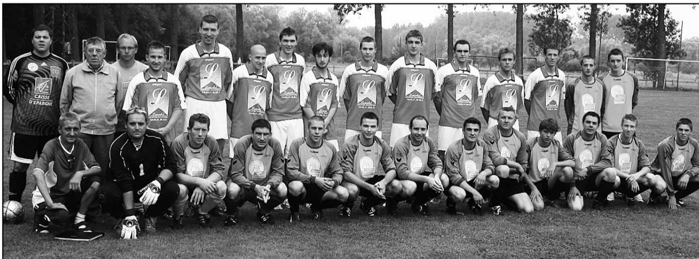
Les équipes de Roquetoire et Mametz.

Bénéficiant du beau temps, la manifestation sportive a connu la réussite attendue. L'épreuve était dotée des trophées Pierre-Marie Dacquain et Philippe et Jean-Luc Pauchet. Finalement, les Roquestoriens se sont montrés les meilleurs et ont remporté les deux trophées, précédant Quiestède, l'ESSOR, Mametz, Coyecques et Boisdinghem.